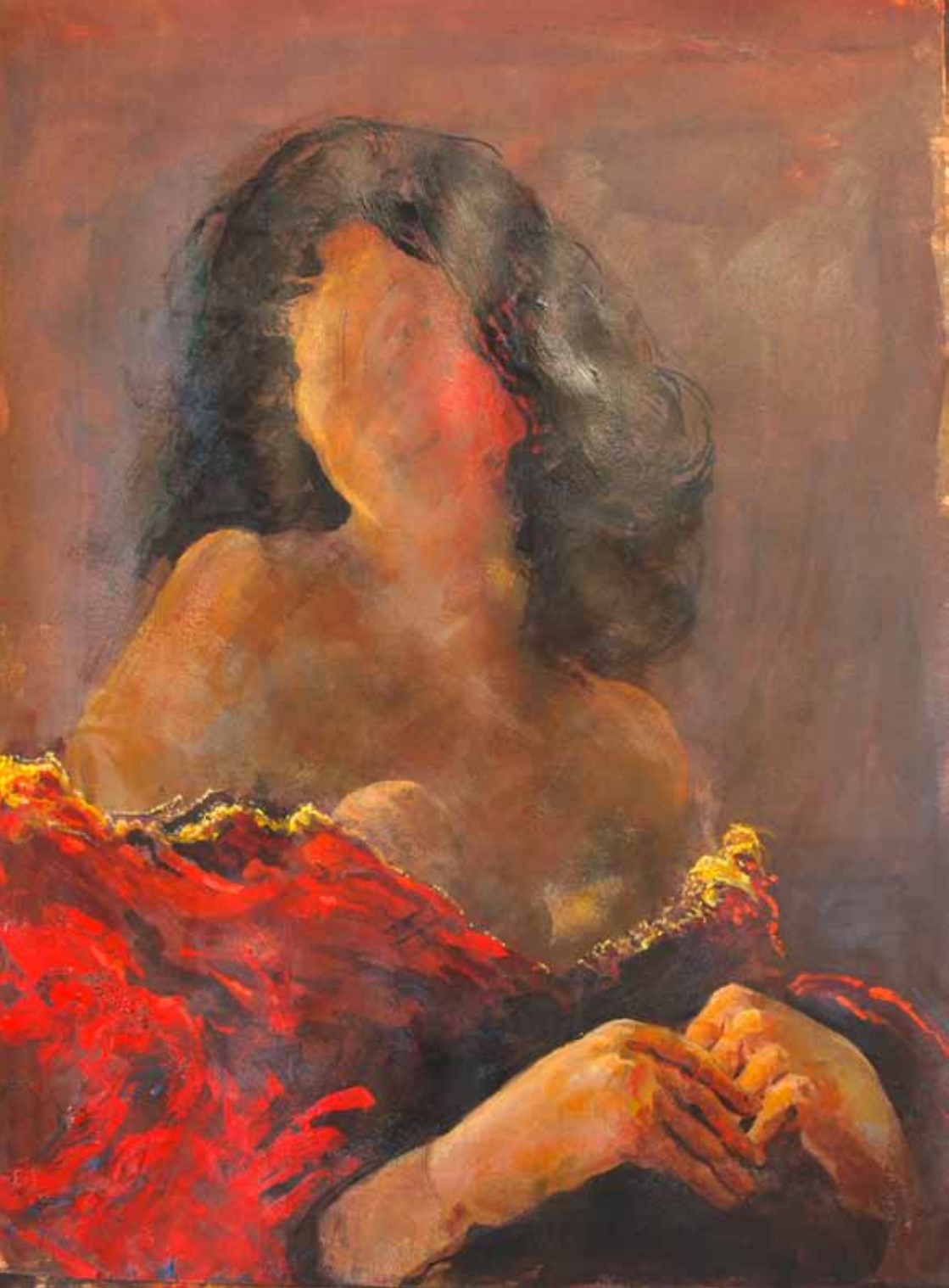
aus der Serie «Ahnen», 2016; Gouache, je 76 x 56 cm