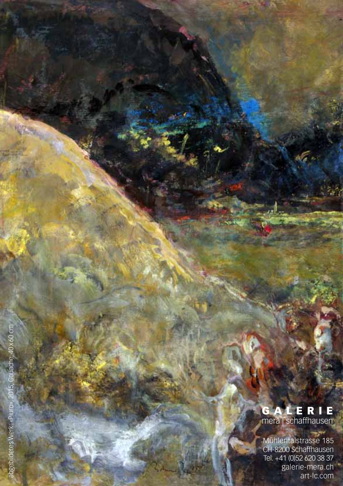
abgebildetes Werk: «Piuro», 2015, Gouache, 40 x 60 cm