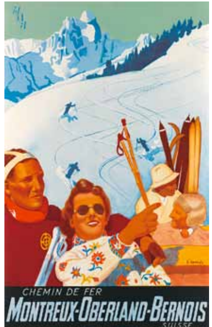
Eric Hermès, 1929; Lithographie, 103 x 64 cm