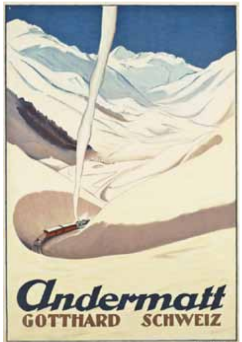
anonym ("T."), 1927; Lithographie, 102 x 68 cm