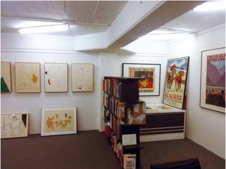
Ansicht unseres neuen Ausstellungsraums im oberen Geschoss.

Parallel zu unseren wechselnden Ausstellungen haben wir uns als Händler auf das künstlerische Werk Le Corbusiers sowie auf Originale Plakate spezialisiert. So können wir im Falle LCs unterdessen eine Fülle von zumeist handsignierten Graphiken anbieten – siehe etwa auf unserer Site art-1c.com –, wie sie kein zweites Mal zu finden ist.