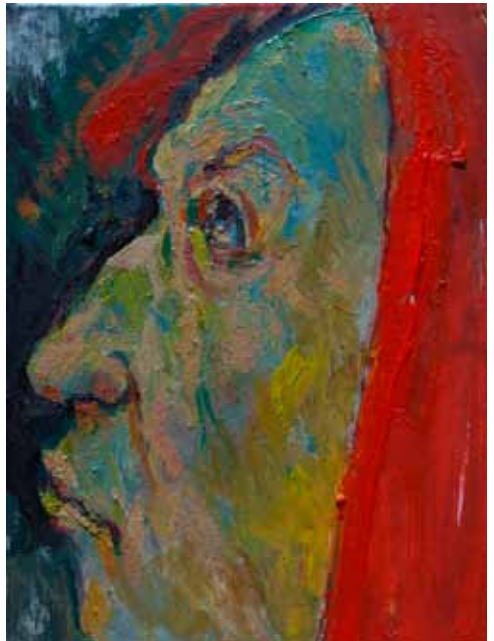
aus der Serie «Köpfchen», 2015/16; Öl auf Leinwand, je 24 x 18 cm